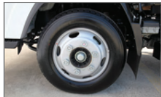
고급 미쉐린 타이어