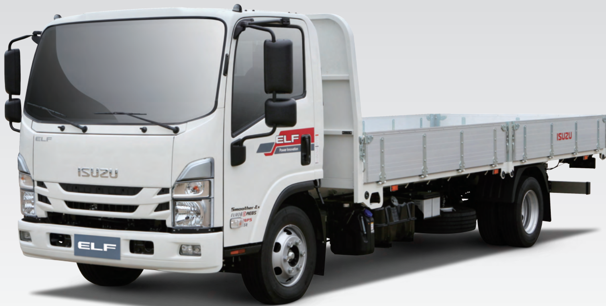
3.5톤 엘프 주요제원

바닥과 전면에 고장력강을 적용하여 추가 보강 불필요 사이드와 리어 게이트에는 알루미늄 판넬을 사용하여 내식성이 우수함