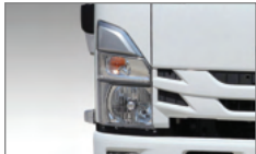
모던한 디자인의 헤드램프