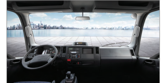
시계성이 우수한 운전공간