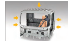
고강성 캡(ECE Regulation 29만족)