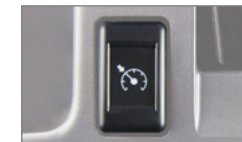
크루즈 컨트롤 시스템