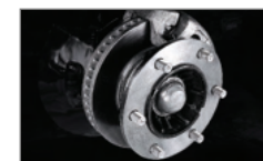
전/후륜 디스크 브레이크